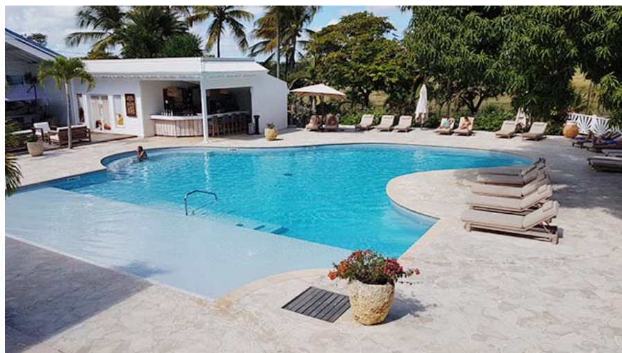
Le Relais du Moulin à Saint-Anne - Guadeloupe

Cette année les actions de formation se sont tenues dans un lieu très agréable et extraordinaire de calme et de sérénité : " Le Relais du Moulin " à Saint-Anne .